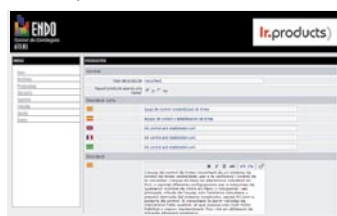
Fitxa de productes