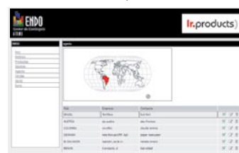
Gestió d'informació per zones