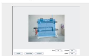
Fitxa de productes