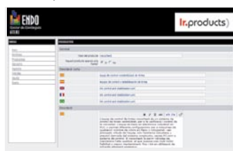
Fitxa de productes